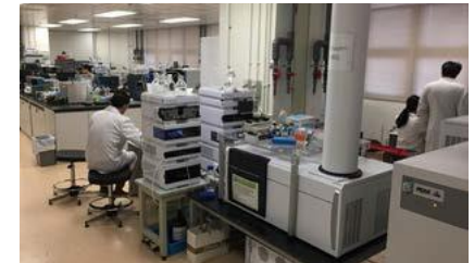
生命科学中心 实验室