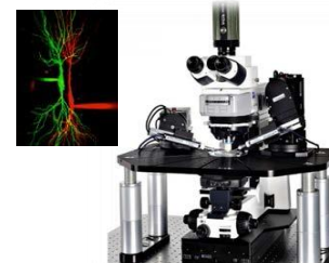
神经科学中心 实验室