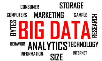
大数据分析中心 实验室