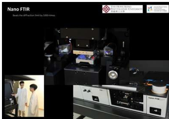
科學和環境分析中心 实验室