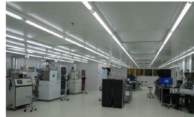
材料与器件中心实验室