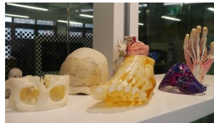
三维打印技术中心 实验室