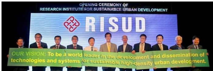
可持續成市發展研究院